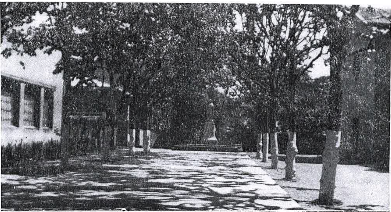
Patio del Sagrado Corazón