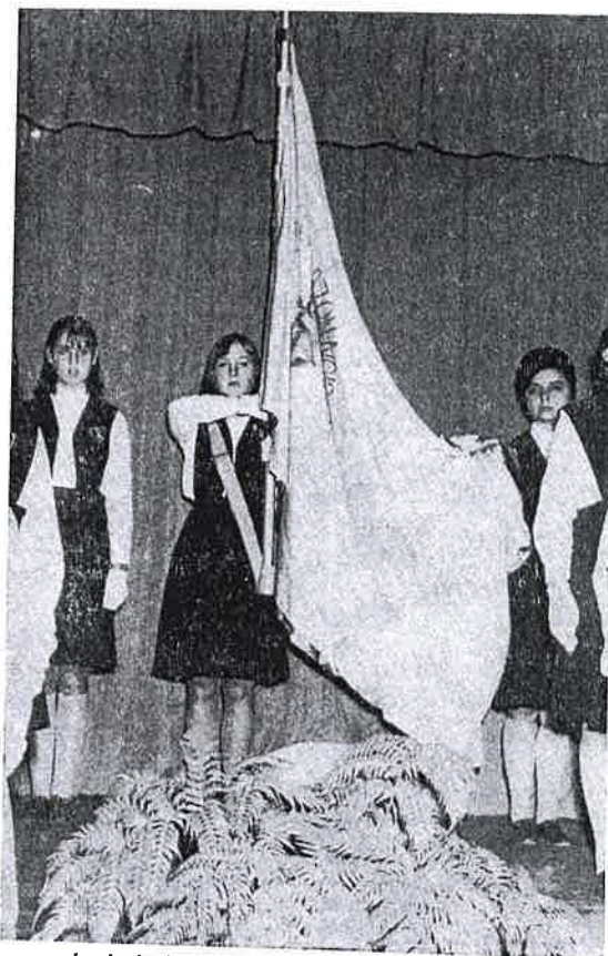
La insignia del Colegio con sus abanderadas

Amanece el 24 de Mayo. —Ultimo día de PREPARACION. Se siente correr en toda la Casa: Gozo... paz... y actividad... ¿todo está listo? "Sí" las Antiguas despacharon las invitaciones. El horno de la cocina despachó por mayor: Galletas, pastelitos, tortas y latigudos... Los ensayos de guitarra han sembrado armonía y cantos en las Salas de clases... En su casa las Antiguas también saben preparar... bien lo dicen las bandejas, los canastos de frutas y las flores que golpean las puertas